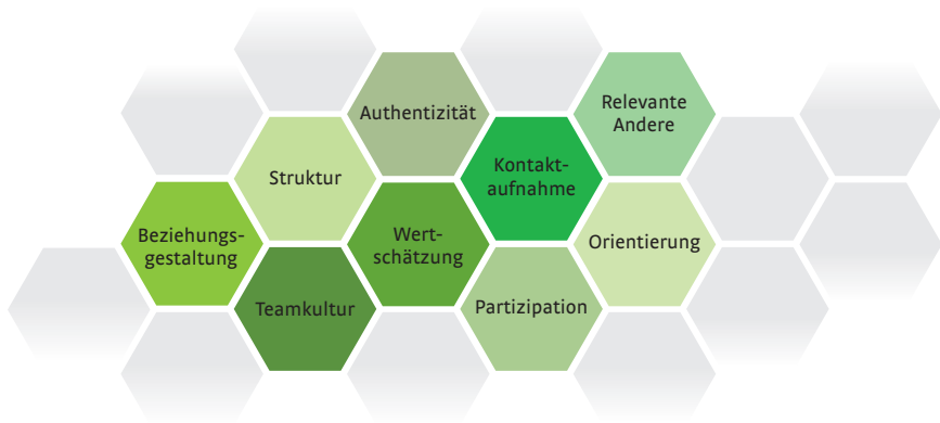
Abbildung 3: Neun Bausteine guter Praxis